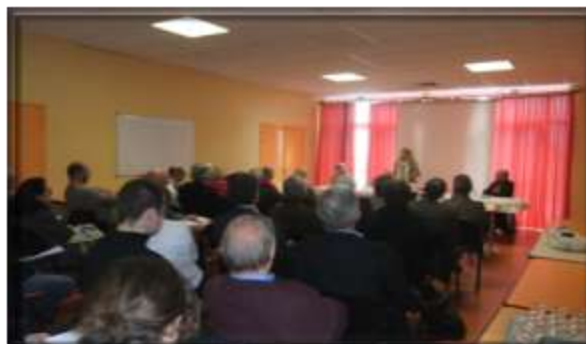
Mobilisation de l'ensemble des propriétaires Assemblée Générale 2012

Le C.L.L.A.J. nécessite le soutien financier des organismes de tutelle, notamment celui du Conseil Régional pour pouvoir maintenir ce dispositif très apprécié par les jeunes et les propriétaires bailleurs. C'est la valorisation du territoire tout entier qui se joue avec la reconnaissance des acteurs de terrain (élus, collectivités, bailleurs sociaux et privés...)